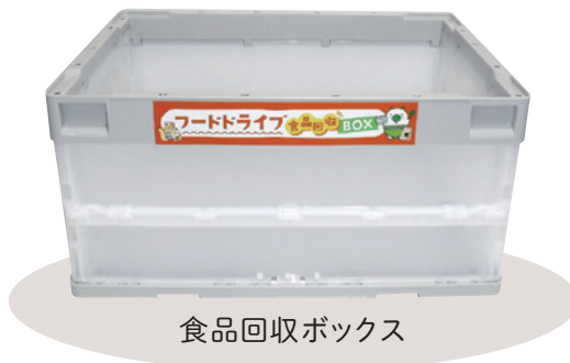
食品回収ボックス

県内の企業や団体がフードドライブ活動を積極的に実施できるよう、フードドライブ用資材(食品回収ボックスとのぼり)の貸出しを行っています。貸出しを希望する場合は、県ホームページからお申込みください。