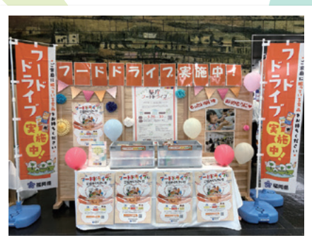
フードライブ活動