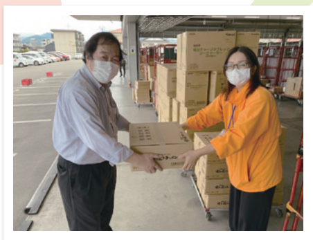
フードバンク活動

フードバンク・フードライブ活動は、 業種や規模に関わらず、 どんな企業や団体でも参加できる活動です。 食品ロスを削減するだけでなく、 食品を必要とする方々への 支援にもつながるこの活動に、 皆さんも参加してみませんか？